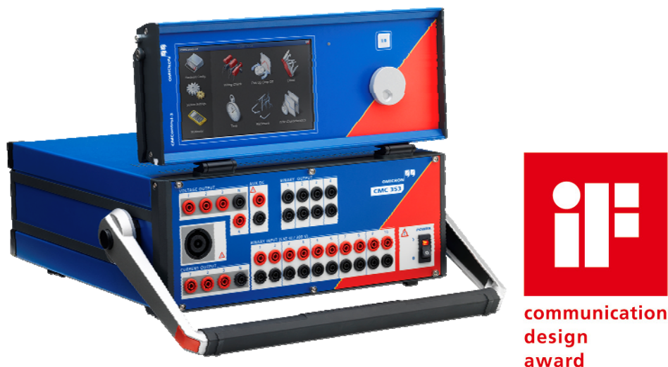
Abb. 2: CMControl Bedienterminal für das CMC-Prüfgerät von OMICRON electronics – mit dem iF communication design award 2010 ausgezeichnetes Design von Centigrade

Die Möglichkeit, automatische Regressionstests direkt in diese Infrastruktur einzubinden, ist insbesondere für agile HMI-Software-Entwicklung entscheidend, um die zunehmende Funktionalität in der Entwicklung kontinuierlich absichern zu können. Tools wie GoogleTest bieten für HMIs die Möglichkeit, einen virtuellen Nutzer zu simulieren. Dabei werden Benutzeraktionen aufgezeichnet und als automatische Testfälle wiederverwendet. Große Teile von Software und HMI können so effizient und vollständig automatisiert getestet werden. Für Qt-basierte GUI-Applikationen ist damit auch eine automatische Textlängenverifikation für alle GUI-Elemente und somit die Überprüfung aller Sprachversionen auf Knopfdruck möglich.